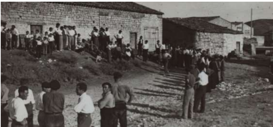
Milicians de l'Exèrcit popular de la República a Peñalba –Osca– (1936-39). 5