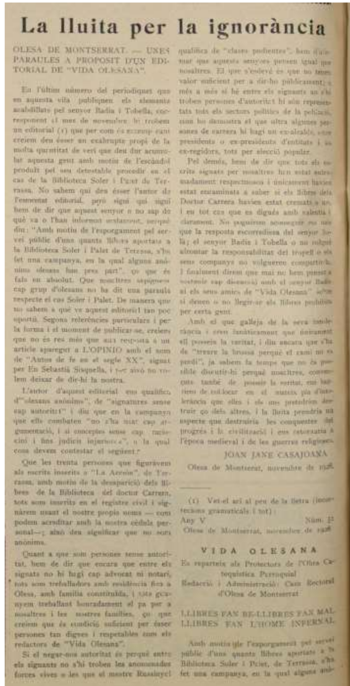
L'Opinió, 15 desembre del 1928.

El que s'esdevé és que no tenen valor suficient per dir-ho públicament; a més a més, si bé entre els signants no s'hi troben persones d'autoritat, hi són representats tots els sectors polítics de la població, com ho demostra el que ultra algunes persones de carrera hi hagi un exalcalde, onze presidents i ex-presidents d'entitats i sis ex-regidors, tots per elecció popular. 20