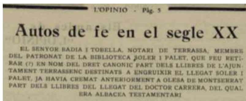
Capçalera de l'article de Sebastià Sisquella. L'Opinió , 10 novembre 1928.

Aviat, el sector catòlic olesà s'afegí a la polèmica i des de la seva publicació Vida Olesana , vinculada a la parròquia, faria una defensa de la moral catòlica, en l'article "Llibres fan bé. Llibres fan mal. Llibres fan l'home infernal". 17 També ataquen el grup de liberals olesans que havia donat suport a l'afer Soler-Palet,