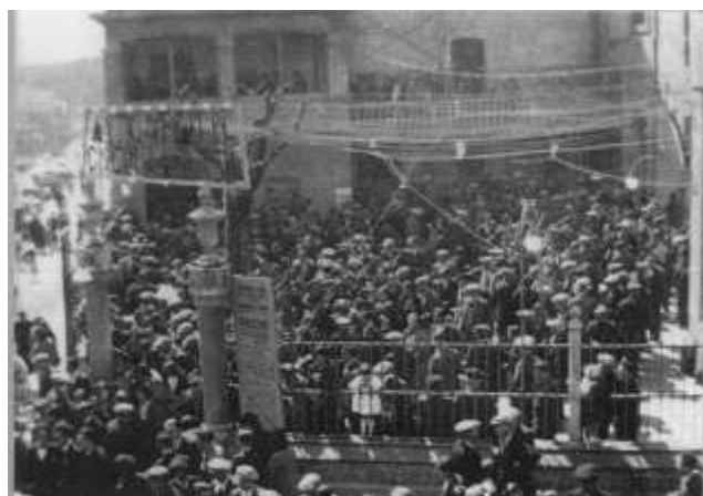
Entrada del Círcol, març 1934.