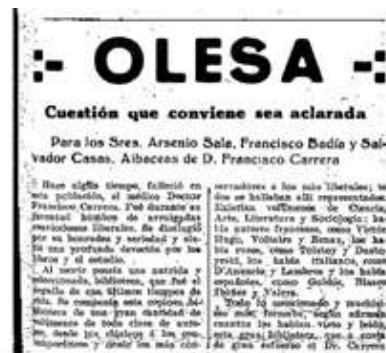
La Acción, 12 de febrer de 1926.