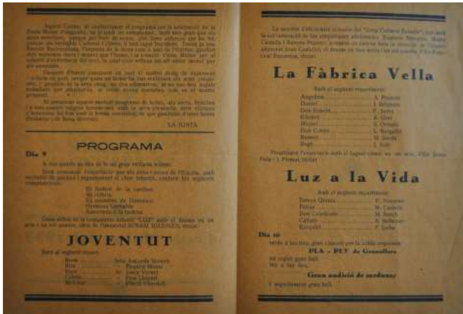
Les dues imatges corresponen al programa de Festa Major de l'any 1933 amb les activitats realitzades pel "Centre Cultural Obrer Esparraguera". En M. Bosch és un dels actors.