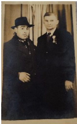
Foto amb un amic a França poc abans de retornar (1946). La família creu que és qui l'havia ajudat a trobar feina en aquest país.

Quan el Francesc marxa a França, la seva esposa, que havia treballat a la fàbrica de cal Montaner i Font, "de les tovalloles" com era coneguda popularment, i que havia deixat la feina per dedicar-se a la seva filla –la nostra testimoni– va haver de posar-se a netejar a diverses cases per poder sobreviure. Es va trobar sola i es va haver d'espavilar com va poder, al temps de les vinyes anava a tallar brots de les vinyes fins que la van tornar a llogar a la fàbrica perquè l'Angunells 19 , que era veí de carrer de la família de la mama, la va deixar entrar. També havia anat a cuinar per algunes famílies. 20