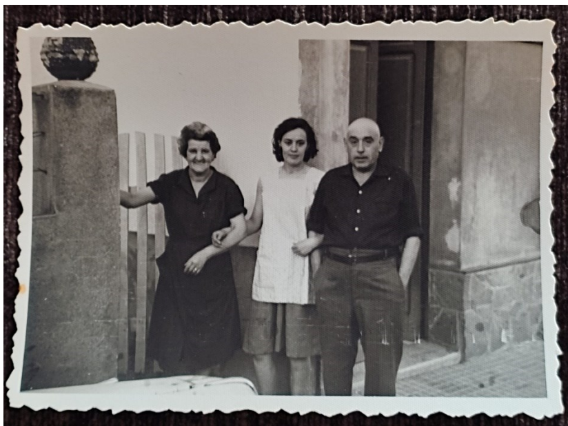
Foto del Francesc al seu retorn amb l'esposa i filla.

Per mi era un home desconegut. Quan el tiet va tenir la família a França, ell es va quedar sol perquè el seu germà va anar a un altre lloc a treballar a les mines. 22