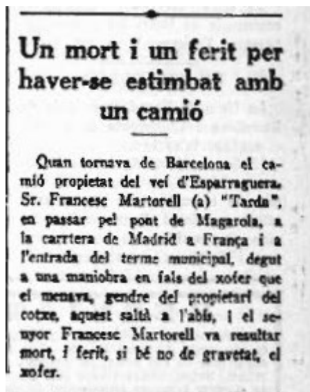
La Publicitat . Barcelona. 23 d'octubre de 1932.