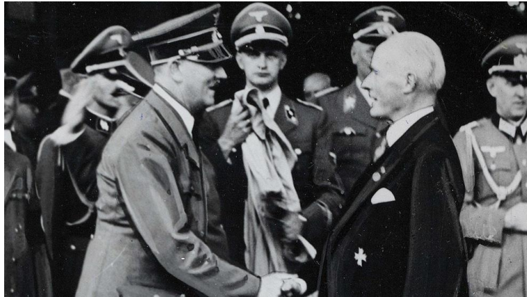
Gustav Krupp rep la medalla del partit nazi (1940). La Vanguardia. 15

obtingut de l'Arolsen Archives, va estar treballant per la firma Krupp a Essen, una ciutat de la Regió del Ruhr –Alemanya–, que va ser molt important per la producció d'acer. Quan Adolf Hitler arribà al poder l'any 1933, aquesta empresa va ser el centre del rearmament alemany. L'any 1943, per ordre de Hitler, la firma va passar a tenir un sol propietari, Alfried Krupp von Bohlen und Halbach, el qual, en finalitzar la Segona Guerra Mundial, va ser condemnat com a criminal de guerra als Tribunals de Nuremberg per haver utilitzat treballadors esclavitzats.