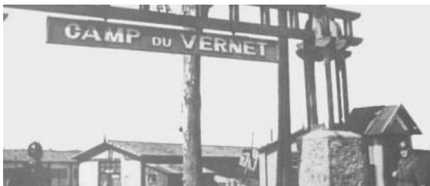
Entrada del camp Le Vernet.

El primer centre d'acollida de refugiats va ser decretat el 21 de gener de 1939; va ser a Rieucros en uns turons boscosos vora l'antic seminari de Mende, al departament