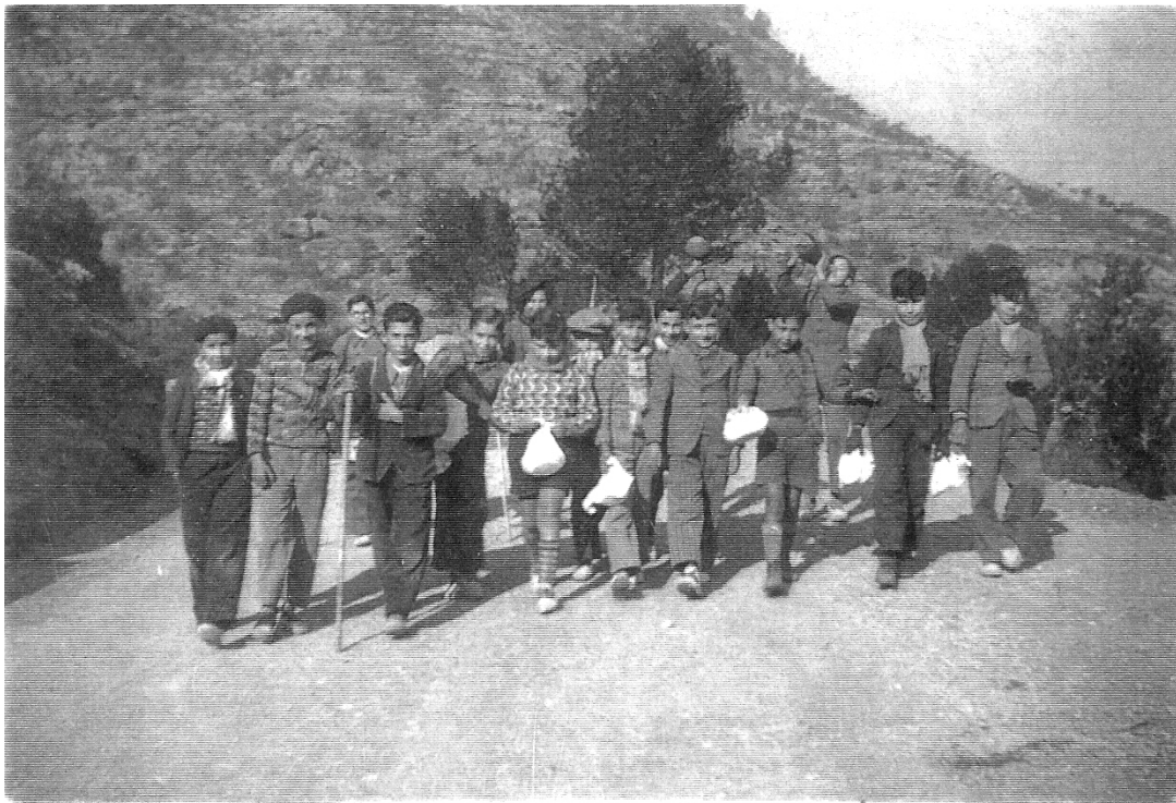
Alumnes de la Colònia Sedó fent una sortida per l'entorn.