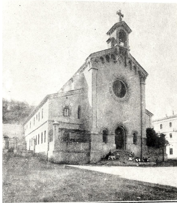
Església de la Colònia Sedó amb l'escola annexada als laterals.

En la fotografia següent podem veure l'escola de Can Sedó, que es trobava annexada a l'església. A la banda dreta hi havia la classe de les nenes i a l'altra, la dels nens. Fins a aquell moment, les monges s'ocupaven de les nenes i el capellà dels nens. En Josep M. Pascual va ser un dels primers mestres laics de la colònia.