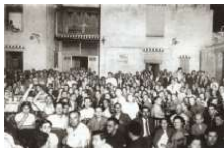
El pati de l'Ateneu en temps de la 2ª República.