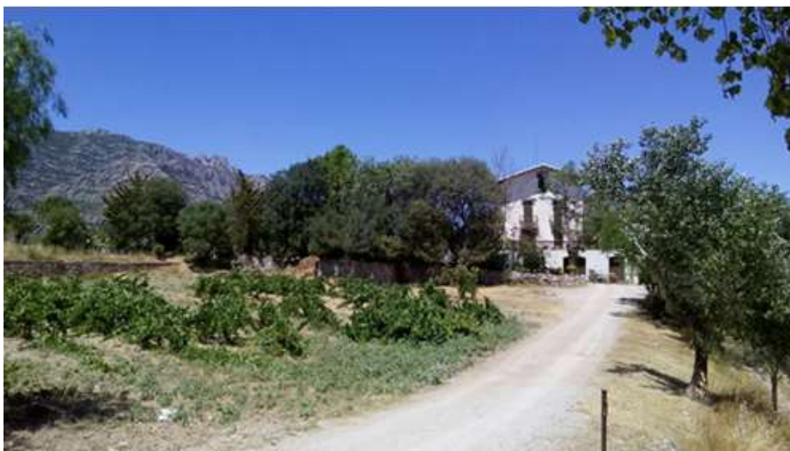
Masia de Can Paloma.

És que tota la joventut és a la guerra! Tenim tota la família a la guerra! Tenim tots els cosins, els marits de cosines, els novios , els germans dels novios ... vull dir, que tota la joventut és a la guerra!