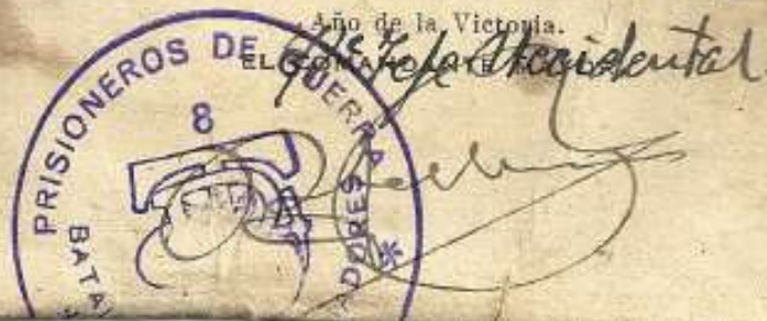
Document del 10 d'octubre de 1939 on s'indica que Àngel Daura va estar al camp de concentració de Canfranc.