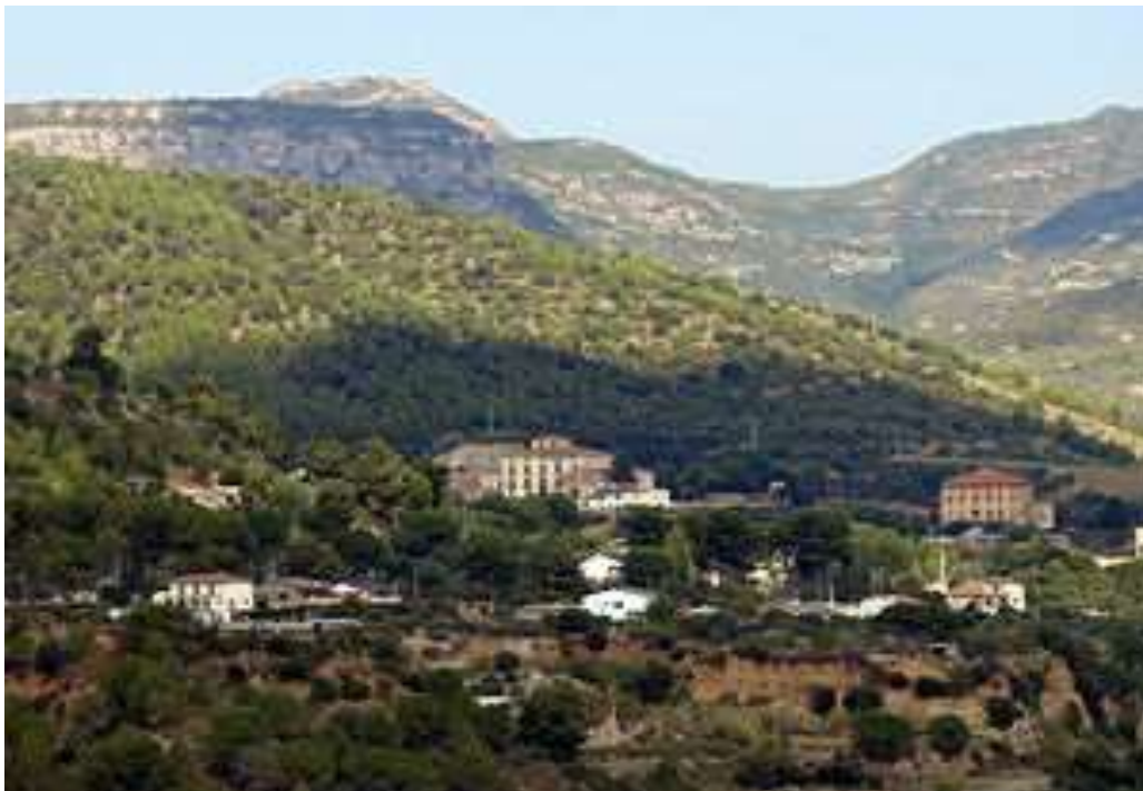
Can Castells propera a Can Paloma, masies situades al camí vell de Monistrol o camí de la cova de l'Ànima.

Durant la revolució, en Daura continuà vivint a Can Paloma, a la casa dels masovers. A la casa dels amos, en alguna ocasió hi havien pernoctat alguns oficials de l'exèrcit. És per això que la família havia baixat alguns objectes de la casa dels amos a casa seva.