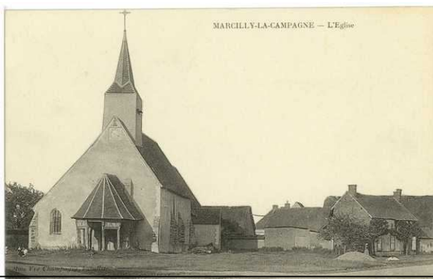
Població on va treballar en Musté l'anv 1940

Deduïm que la família, a Esparreguera estava intentant de vendre els telers de la seva petita empresa, situada al C/Gran núm. 2, ja que necessitaven diners per sobreviure 16 .